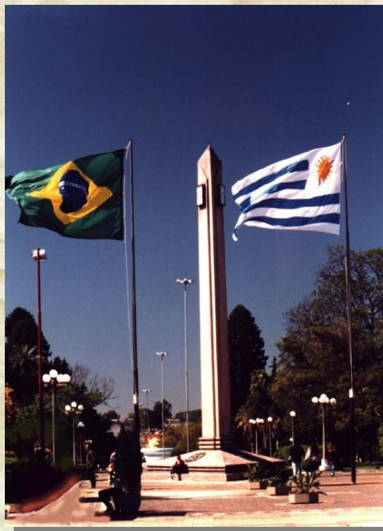
Plaza internacional de Rivera – Livramento

Ficha infográfica en Infoclubes Resumen de enfrentamientos en Segunda División Resumen General de Enfrentamientos Locales